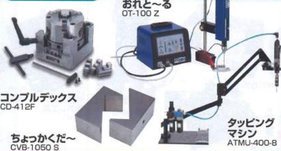
おれと〜る OT-100 Z