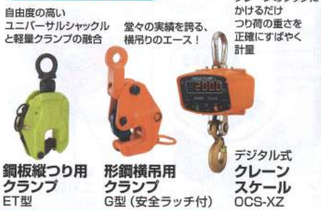
鋼板織り用 クランプ ET型