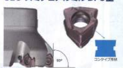
平面削り平面カット SEC-スミデュアルミル DFC型