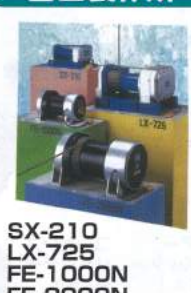
SX-210 LX-725 FE-1000N FE-2000N