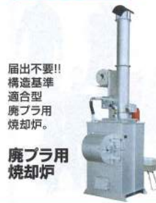
届出不要!! 構造基準 適合型 廃プラ用 焼却炉