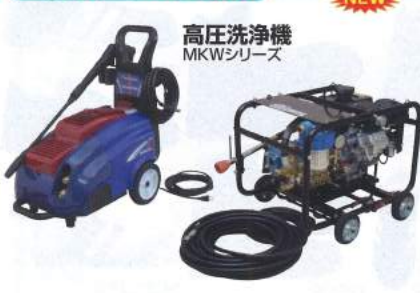
高圧洗浄機 MKWシリーズ