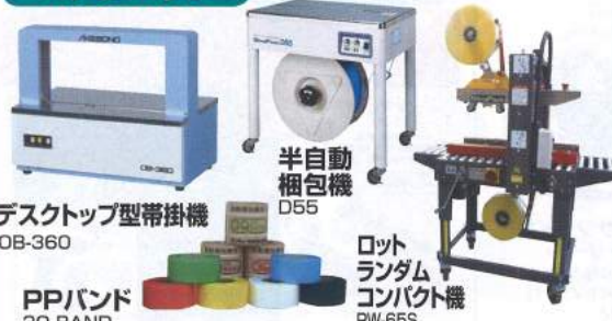
デスクトップ型帯掛機 OB-360