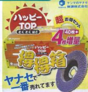
ヤナセで一番売れます!