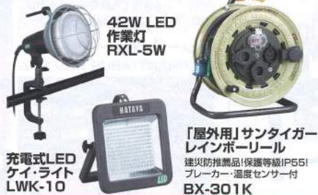
充電式LED ケイ・ライト LWK-10