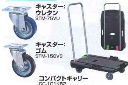
キャスター: ウレタン STM-75VU