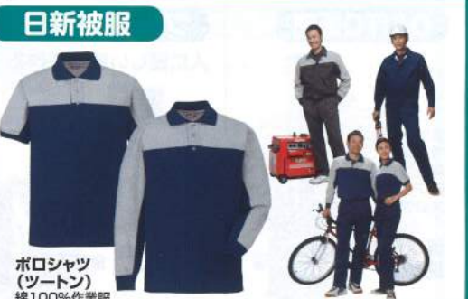
ポロシャツ (ツートン) 綿100%作業服