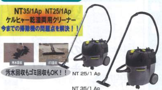
NT35/1Ap NT25/1Ap ケルヒャー乾湿両用クリーナー 今までの掃除機の問題点を解決!!