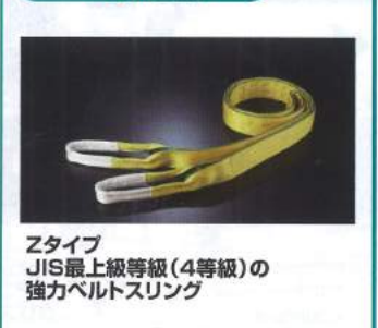
Zタイプ JIS最上級等級(4等級)の 強力ベルトスリング