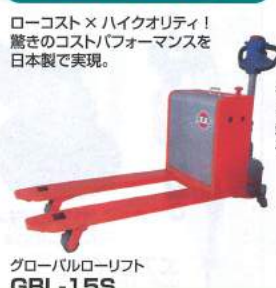
グローバルローリフト GBL-15S