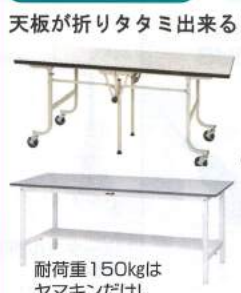
天板が折りたたみ出来る!