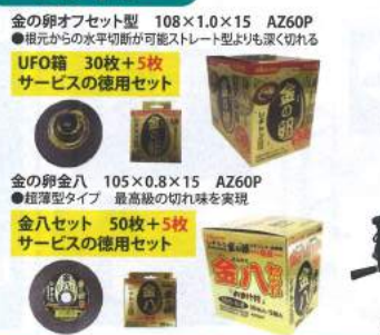
金の卵オフセット型 108×1.0×15 AZ60P ●指元からの水平切断が可能ストリート型よりも深く切れる UFO箱 30枚+5枚 サービスの徳用セット