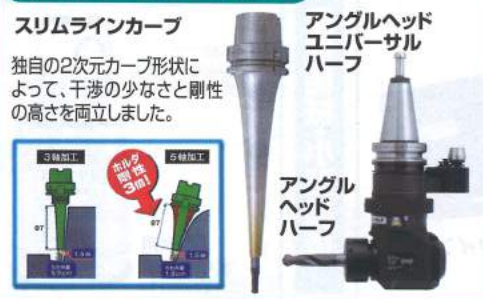
スリムラインカーブ