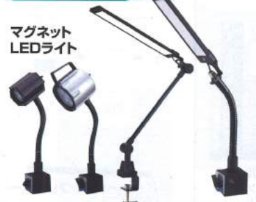
マグネット LEDライト