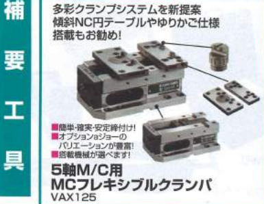
多彩クランプシステムを新提案 傾斜NC円テーブルやゆりかご仕様 搭載もお勧め!