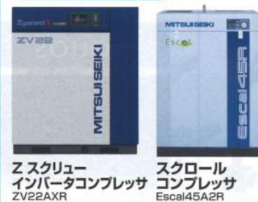
Zスクルー インバータコンプレッサ ZV22AXR