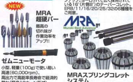
MRA 超硬パー 最高の 切れ味が 作業効率を アップ!!