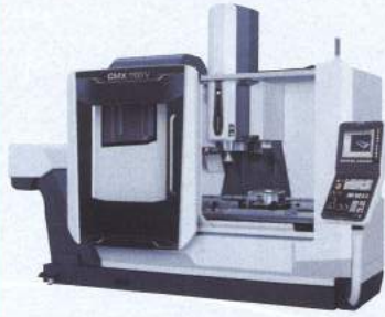
立形マシニングセンタ CMX-1100V