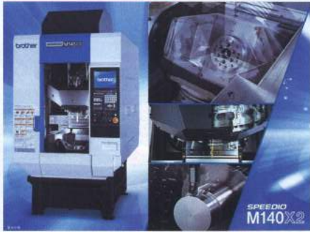
工程集約マシン SPEEDIO M140X2