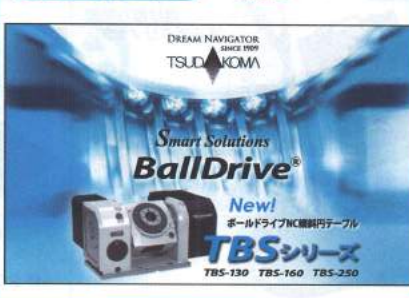
DREAM NAVIGATOR TSUDA XOMA Smart Solutions BallDrive New! ボールドライブNC制御円テーブル TBS-130 TBS-160 TBS-250