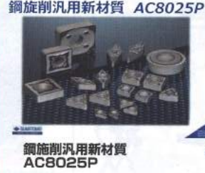
鋼旋削汎用新材質 AC8025P