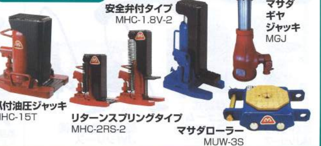
爪付油圧ジャッキ MHC-15T