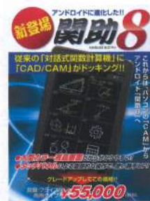
アンドロイドに進化した!! 関助8