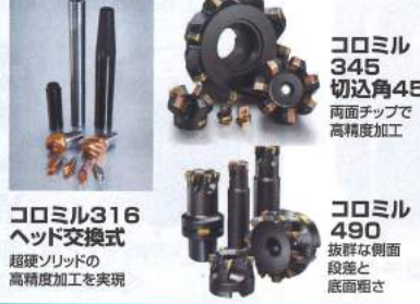
コロミル316 ヘッド交換式 超硬ソリッドの 高精度加工を実現