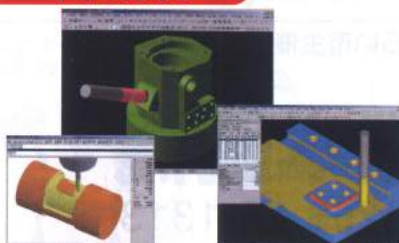
純国産CAD/CAM SpeedyMill Next・たまご etc