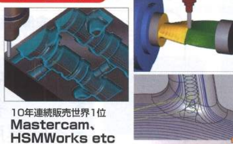
10年連続販売世界1位 Mastercam、 HSMWorks etc