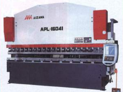
CNC制御高精度プレスブレーキ APLシリーズ