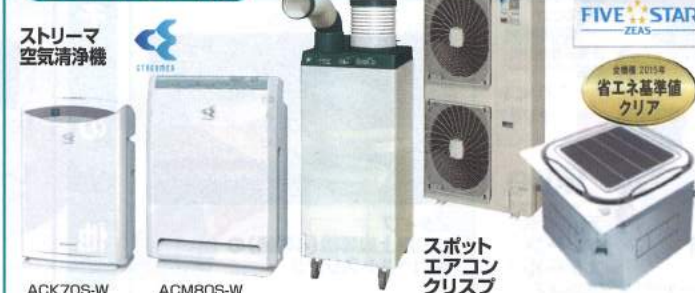
ストリーマ 空気清浄機