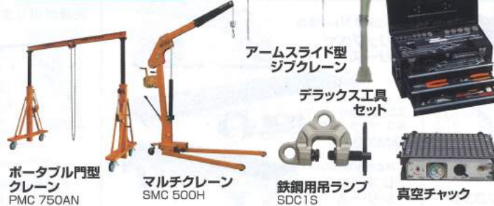
ポータブル門型 クレーン PMC 750AN