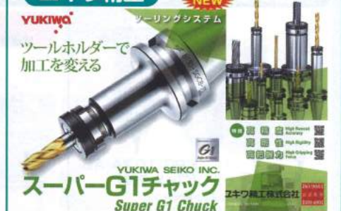
YUKIWA ツールホルダーで 加工を変える