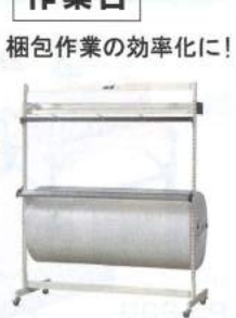
梱包作業の効率化に!