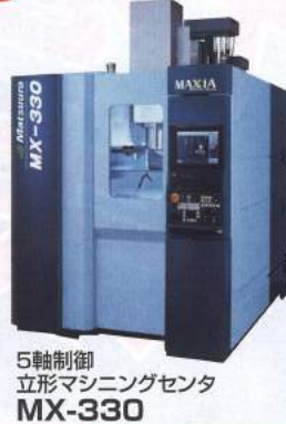
5軸制御 立形マシニングセンタ MX-330