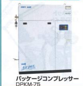
パッケージコンプレッサ DPKM-75