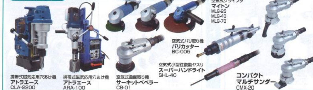
携帯型磁気応用穴あけ機 アトラエース CLA-2200