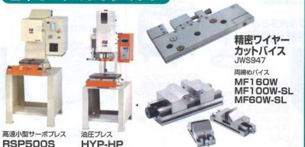
高速小型サーボプレス RSP500S