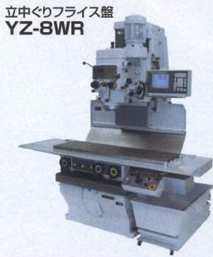
立中ぐりフライス盤 YZ-8WR