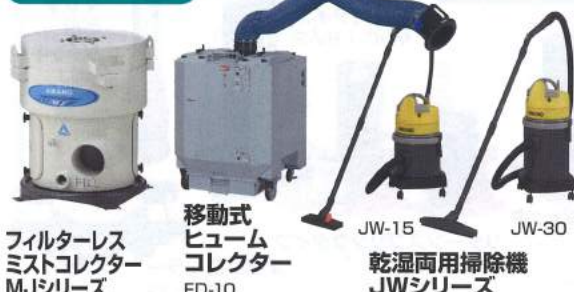
フィルターレス ミストコレクター MJシリーズ