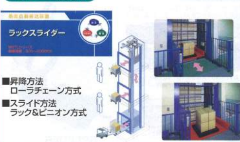
ラックスライダー