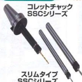
コレットチャック SSCシリーズ