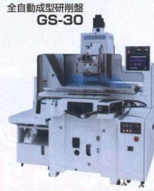
全自動成型研削盤 GS-30