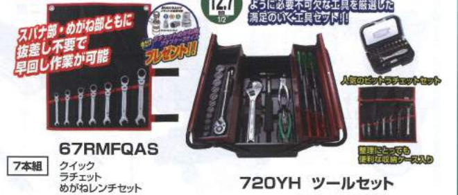
67RMFQAS クイック ラチェット めがねレンチセット