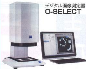
デジタル画像測定器 O-SELECT