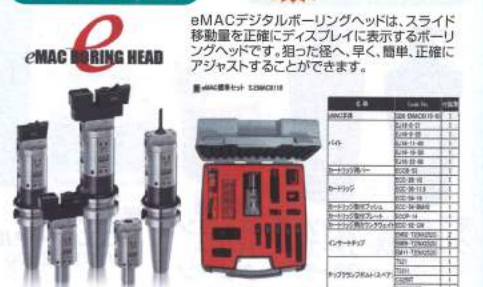
eMAC RING HEAD