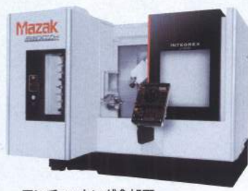
ワンチャッキング全加工 機形複合加工機 INTEGREX j-200