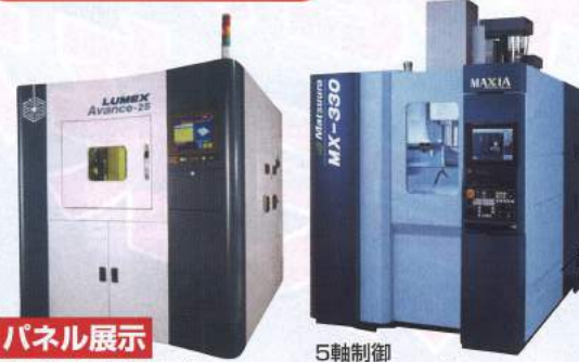
パネル展示 金属光造形複合加工機 LUMEX Avance-25