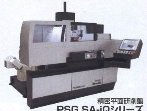
精密平面研削盤 PSG SA-iQシリーズ