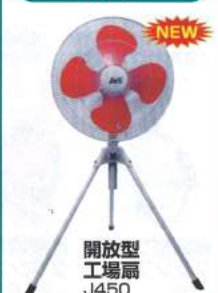
開放型 工場扇 J450