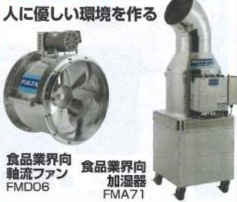
人に優しい環境を作る