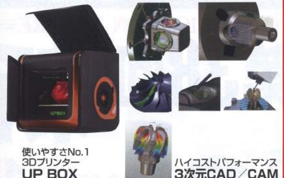
使いやすさNo.1 3Dプリンター UP BOX