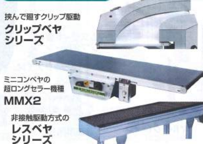
挟んで廻すクリップ駆動 クリップペヤ シリーズ