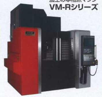
加工の本格派マシン VM-Rシリーズ