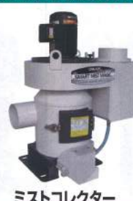
ミストコレクター