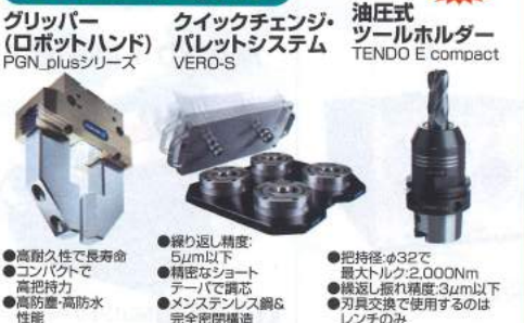
グリッパー (ロボットハンド) PGN_plusシリーズ