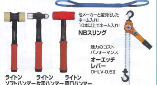
ライト ソフトハンマー片手ハンマー ライト ライト 両口ハンマー