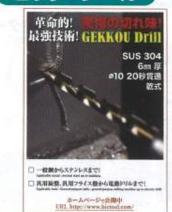
革命的! 最強の切れ味! 最強技術! GEKKOU Drill SUS 304 6mm 厚 φ10 20秒貫通 乾式