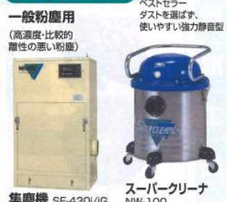
一般粉塵用 (高濃度・比較的 粘性の悪い粉塵)