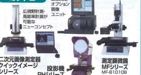
画像測定 オプション 画像 ユニット