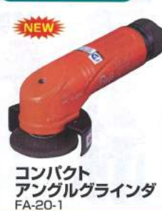
コンパクト アングルグラインダ FA-20-1