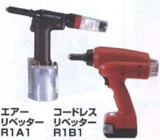
エア リベッター R1A1