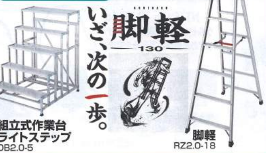
組立式作業台 ライトステップ DB2.0-5