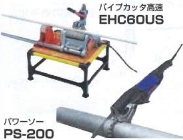
パイプカッター高速 EHC60US