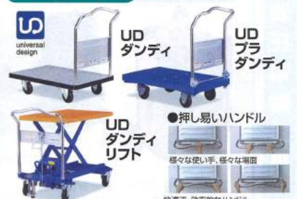
UD ダンディ UD ブラ ダンディ