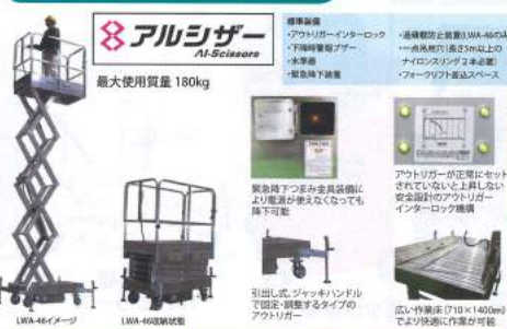
アルシザ Al-Scissors 最大使用質量 180kg LWA-46シリーズ LWA-402R52型