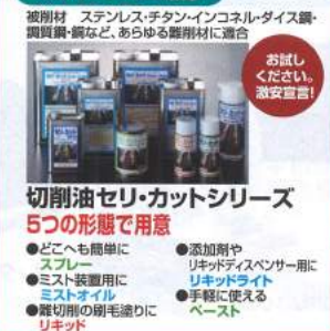
被削材 ステンレス・チタン・インコネル・タングステン 鋼・銅・鋳鋼など、あらゆる難削材に適合