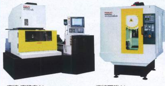
高速・高精度AI ワイヤカット放電加工機 FANUC ROBOCUT