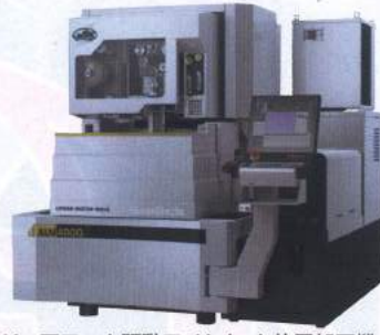
リニアモータ駆動ワイヤカット放電加工機 ALNシリーズ