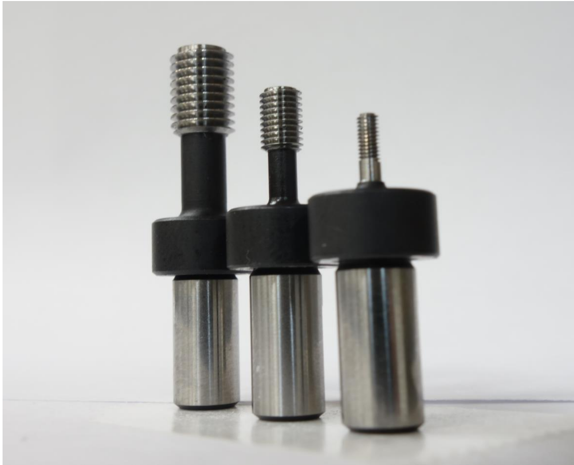
Bee-1 専用 ねじゲージ